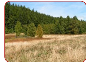
Haut-marais de la commune du Lieu

Créé à l'initiative de ses habitants, le parc est une région modèle pour un développement durable. Il initie et soutien des projets qui mettent en valeur la nature, renforcent les activités économiques axées sur le développement durable et sensibilisent différents publics à l'environnement, tels que la Conférence EUROPARC.