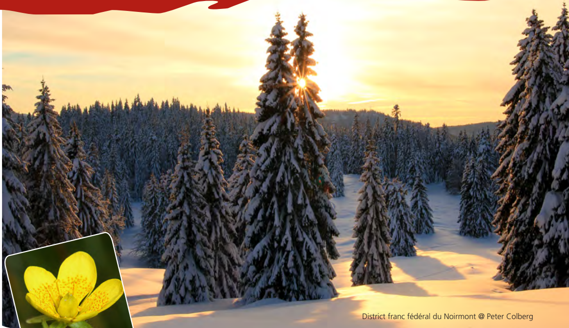
District franc fédéral du Noirmont