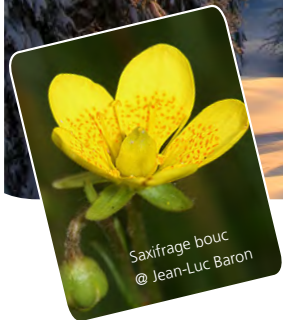
Saxifrage bouc @ Jean-Luc Baron