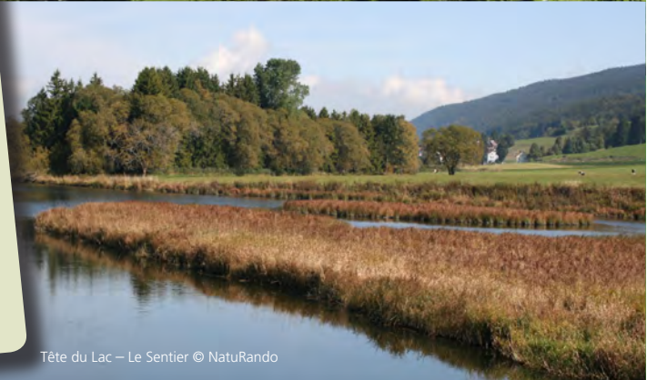
Tête du Lac – Le Sentier

Le plus grand massif forestier d'un seul tenant de Suisse, le Grand Risoud