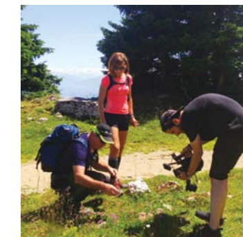
Réalisation d'un reportage audiovisuel

Presse écrite, radios, télévisions, manifestations ou encore réseaux sociaux, le PJV a intensifié sa communication en 2017 via une multitude de canaux afin d'une part de valoriser les partenaires et personnes engagées dans son territoire et d'autre part de faire mieux connaître nos actions au grand public afin d'en bénéficier.