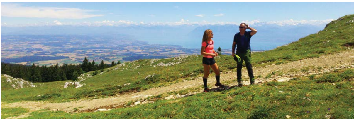
Randonnée dans le Parc Jura vaudois avec vue sur les Alpes

Le PJV est membre du groupe de travail pluridisciplinaire « Gest'Alpe » qui vise la promotion de l'économie alpestre vaudoise et la formation continue de ses acteurs dans la région d'estivage. La démarche « Gest'Alpe » permet de mettre en relation cohérente les politiques publiques avec les intérêts privés ou associatifs qui prennent place dans la zone d'estivage du PJV. Les actions du groupe de travail menées en 2017, devraient prochainement conduire à une simplification des démarches administratives liées aux plans d'exploitation et de gestion des alpages. Sur la base de ces échanges fructueux, le PJV prévoit d'étoffer l'appui proposé aux communes dans la valorisation et l'entretien des alpages.