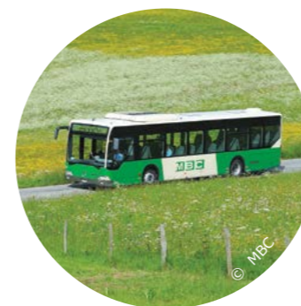
Augmentation des fréquences de desserte sur les 3 cols

Ces trois cols constituent des portes d'entrée évidentes pour se rendre sur les crêtes du Jura vaudois. En termes de mobilité, l'offre en transports publics a été renforcée pour accéder aux cols du Marchairuz et du Mollendruz. La période et le nombre de dessertes ont été significativement étendus et les nouvelles courses sont à l'horaire depuis le printemps 2017. Un large soutien des communes, ainsi que la participation de Régionyon, de l'ARCAM et du Canton (DGMR), ont permis de financer l'extension de l'offre. Grâce à des actions de promotion menées en étroite collaboration avec les transporteurs - CarPostal, NStCM et MBC - Régionyon et Bus alpin, les visiteurs ont été largement encouragés à se rendre sur le lieu de leurs loisirs en transports publics. En 2017, la ligne du Col du Marchairuz a accueilli 2'524 passagers, alors que 2'511 passagers ont emprunté la ligne du Col du Mollendruz.