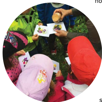
Animation pédagogique en pleine nature

Le PJV propose des animations pédagogiques aux écoles de son périmètre et des alentours. Ces animations sont pluridisciplinaires, transversales et ludiques. Elles se déroulent en pleine nature et ont pour but de faire découvrir aux jeunes générations la richesse de notre région. Les sept thématiques d'animations proposées ont été élaborées en cohérence avec les exigences du Plan d'étude romand (PER). 85 classes (2'000 élèves environ) ont participé à des animations pédagogiques en 2017. Grâce à un partenariat avec le Conseil régional du district de Nyon, onze animations ont également été offertes gratuitement aux classes de notre région.