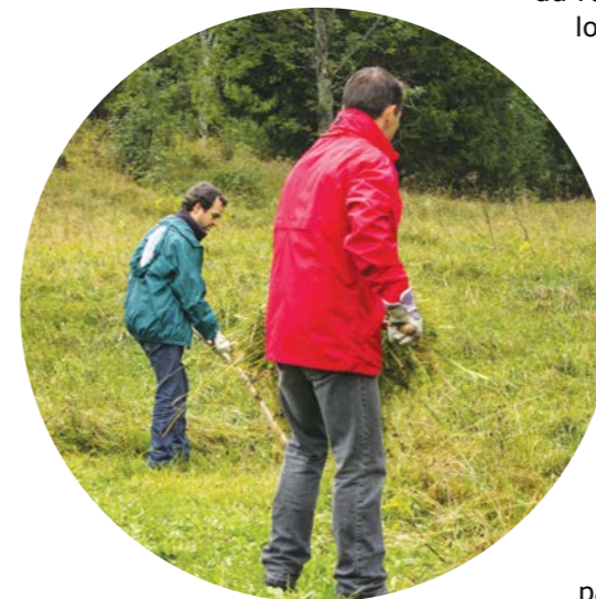
Des bénévoles en action sur le site naturel du Brassus

La Confédération a initié, dès 2016, un projet pilote dans les parcs suisses visant à améliorer le réseau des milieux naturels (appelé infrastructure écologique) dans le but de freiner la perte de biodiversité. Début 2017, le canton de Vaud a mis à disposition du PJV un diagnostic finalisé présentant l'état actuel de l'infrastructure écologique de son périmètre. Sur la base de celui-ci, le PJV a mené une analyse approfondie de la commune de Mollens. L'objectif à terme est de pouvoir proposer un diagnostic de l'infrastructure écologique à chaque commune et de leurs proposer des pistes d'amélioration de leur réseau de milieux naturels. Le forum annuel du PJV de juin 2017 a également permis d'approfondir la thématique lors d'ateliers participatifs.