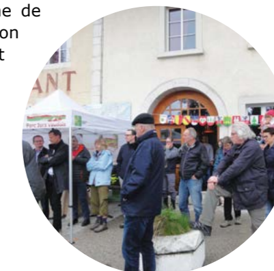
Inauguration de la nouvelle offre en transports publics au col du Marchairuz

Par ailleurs, les cols sont également des emplacements idéaux pour entrer en contact avec les visiteurs et les sensibiliser aux nuisances potentielles sur l'environnement et l'agriculture en cas de comportement inapproprié (Voir Sensibiliser le grand public, un enjeu central).