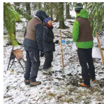
Action de sensibilisation des randonneurs

Le PJV a été sollicité par plusieurs communes et agriculteurs pour sensibiliser les randonneurs à la faune et à la flore de son périmètre de même qu'aux nuisances générées par les déchets sur nos alpages. Afin de répondre à cette demande, un projet de sensibilisation des visiteurs sur les trois cols a été mis en œuvre en 2017. Grâce à l'intervention d'animateurs qualifiés, les problématiques des déchets et du dérangement de la faune sauvage sont abordées via des quizz, des puzzles et d'autres outils didactiques sur un stand