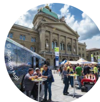
Marché des parcs suisses sur la Place Fédérale

Le label Produit des parcs suisses se fait de mieux en mieux connaître au travers des nombreuses manifestations organisées par le PJV ou lors d'événements d'importance durant lesquels le PJV est présent. Ce fut le cas en 2017 lors du Marché national des parcs suisses à Berne, de la Fête des habitants du PJV à Chésereux ou du salon Goûts & Terroirs à Bulle. Ce sont ainsi plusieurs milliers de personnes qui ont pu découvrir la gamme des produits labellisés du PJV. De plus, des producteurs se sont adressés spontanément au PJV pour démarrer un processus de labélisation, ce qui nous encourage à poursuivre nos efforts en 2018.