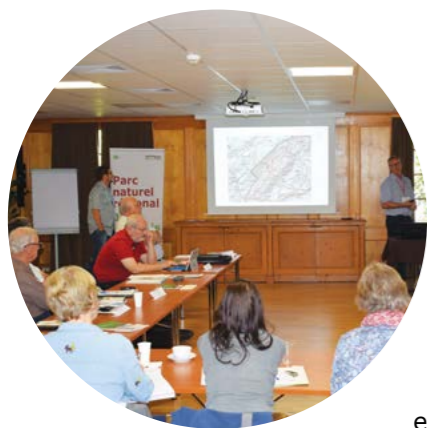
Journée de sensibilisation et d'information sur les IFP

L'Inventaire fédéral des paysages, sites et monuments naturels (IFP) recense les paysages helvétiques les plus précieux. La moitié du territoire du PJV a été inscrite dans cet inventaire. Une journée de sensibilisation et d'information sur les IFP a été organisée à la Vallée de Joux en automne 2017. Des gestionnaires du paysage (municipaux, forestiers, responsables touristiques, responsables des régions et aménagistes) ont été invités à échanger sur cette thématique parfois ardue à appréhender. Des présentations de différents partenaires, une visite d'un cas concret sur le terrain et des ateliers de travail ont permis de mieux comprendre l'importance de ces paysages de grande valeur, les enjeux liés aux IFP et les opportunités de valorisation à approfondir.