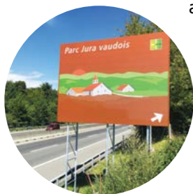
Panneau en bordure d'autoroute pour une visibilité accrue

Trois journaux ont été diffusés en tous-ménages (60'000 exemplaires) dans les 30 communes territoriales du PJV. Le site web a quant à lui été entièrement mis à jour dans une optique d'accès facilité à l'information. Des articles ont également été publiés dans la presse locale et régionale de façon régulière. 6 capsules vidéo sur les projets du PJV ont été tournées en partenariat avec ValTV. Chaque reportage a été diffusé en continu sur ValTV durant plusieurs semaines, touchant environ 100'000 foyers. Nous vous invitons à consulter notre chaîne YouTube pour les visualiser.